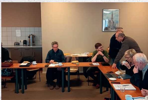
■ Vergaderingen van de Synode Raad en de districtsvoorzitters worden gehouden in de Brogniezstraat.