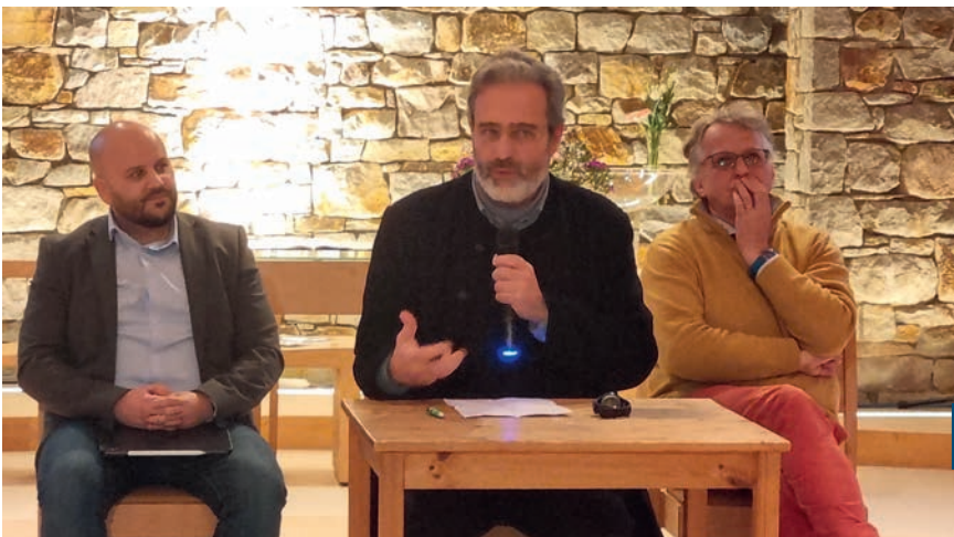
© Salvatore Manfredi, pater Christophe d'Aloisio, Benoît Bourguine (foto met dank aan S. Manfredi)