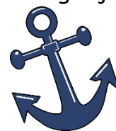
Figuur 1 Anker symbool van hoop